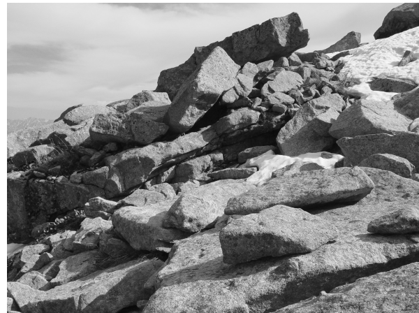
Рис. 2. Местообитания N. roddi на хр. Листвяга. Fig. 2. Habitats of N. roddi in Listvyaga Mt. Range.

Распространение. N. roddi имеет очень небольшой ареал в юго-западной части Алтая: от восточной оконечности хр. Листвяга, через южные отроги Катунского хребта до западной части плоскогорья Укок (рис. 1).