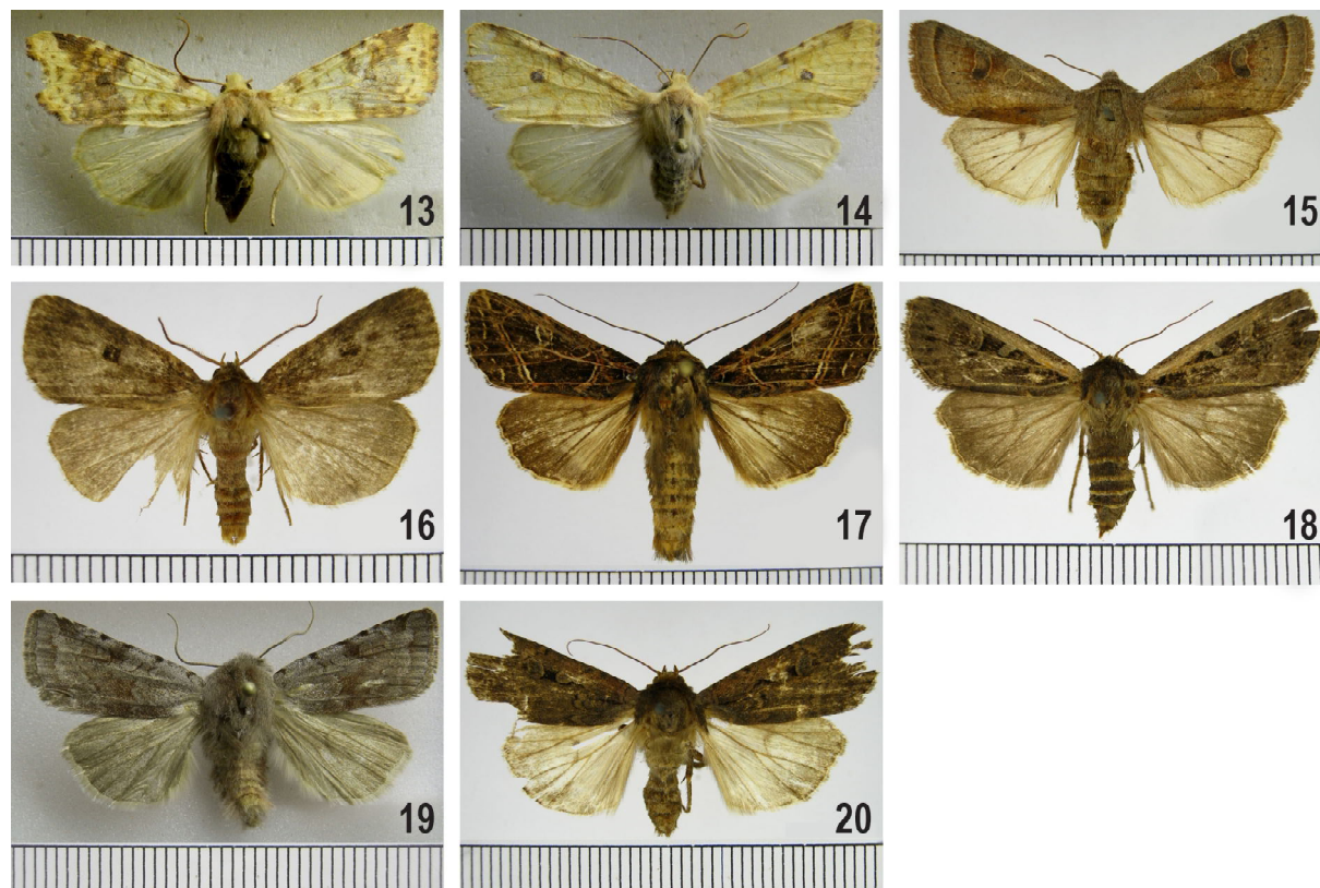
Рис. 13–20. Совки острова Сахалин, вид сверху: 13–14 — Xanthia tunicata , Ясноморское, 18–19.09.2019 (13), 16–17.09.2019 (14); 15 — Orthosia ella , Холмск, 11.05.2017; 16 — Xestia descripta , Ясноморское, 18.07.2019; 17 — Dictyestra dissecta , Холмск, 1.08.2016; 18 — Euxoa karschi , Холмск, 13.08.2017; 19 — Cerastis rubricosa , Холмск, 22.04.2018; 20 — Spaelotis ravida , Холмск, 15.09.2017.