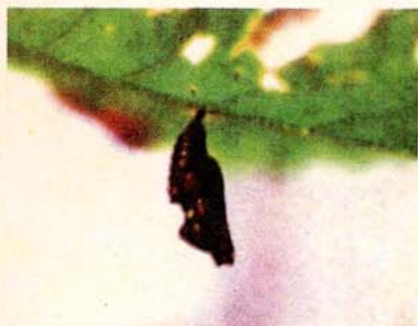
К стр 213: Arashnia burejana (Аргунь).