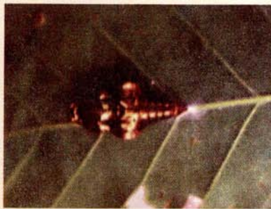
К стр. 211: Neptis thisbe (Аргунь).

На первой странице обложки: слева сверху — Ophiogomphus spinicornis (р. Онон, 1996); справа сверху — Niphanda fusca (р. Онон, 1996); слева внизу — Melitaea romanovi (Чихалан, 1996); справа внизу — Gampsocleis gratiosa (пос. Нерчинский завод, 1997).