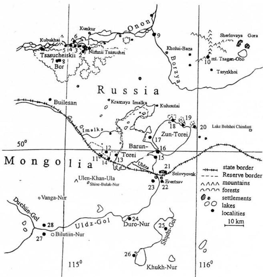
Рис. 1. Места сбора материала в заповеднике «Даурский» и сопредельных территориях в 1995 – 1997 гг.

23 июля – Эльтруд (3), Хух-Нур (3), Дуро-Нур (17); 24 июля – Эрэнцав (4), Авдар-Толгой (2); 25 июля – Чулун-Хорот (1) (В. Дубатовлов); 29 июля – Бор (2) (В. Бриних); 31 июля – Правый берег (3); 5 августа – Бор (4); 15 августа – Ходонята (5); 16 августа – Цасучей (2); 18 августа – Правый берег (10), Левый берег (3); 21 августа – Правый берег (2); 22 августа – Бор (9); 23 августа – Правый берег (3), Верхняя пойма (10) (В. Дубатовлов).